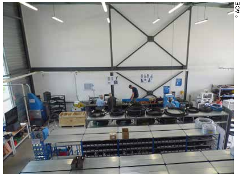
Le nouveau site est parfaitement adapté à l'activité de l'entreprise, mais également tout à fait conforme à l'image de la société ACE tout entière.

De fait, aujourd'hui, ACE est un véritable petit groupe qui emploie 152 personnes et devrait réaliser un chiffre d'affaires de 24,5 millions d'euros cette année (contre 21,5 millions d'euros en 2015). Au-delà de son siège de Dijon, qui regroupe le stock central et l'ensemble des moyens d'études et de fabrication, l'entreprise bourguignonne s'est étendue géographiquement au fil du temps en s'implantant à Clermont-Ferrand, puis à Montluçon et à Chalon-sur-Saône. Au cours des deux dernières années, ACE a augmenté sa zone de chalandise avec la création des sites de Limoges et de Saint-Etienne.