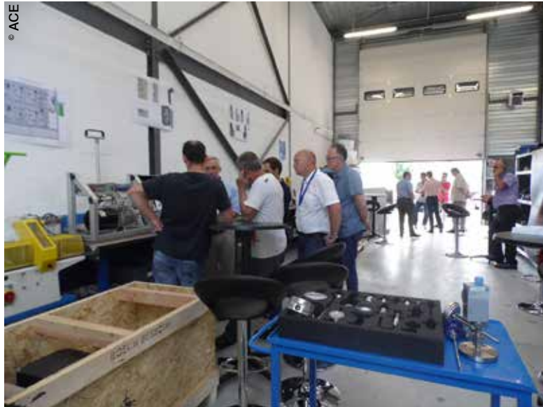
ACE sait qu'elle peut compter sur le soutien de ses partenaires fournisseurs dans le cadre de la réalisation de ses projets de développement.