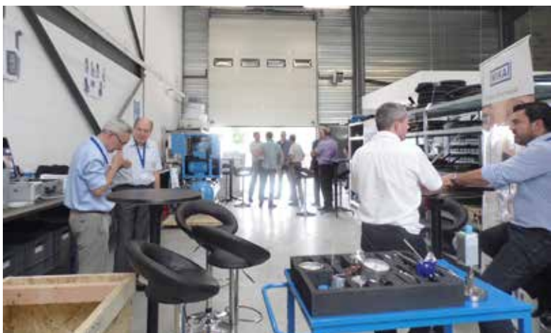
Les prestations d'ACE démarrent dès la phase de conception des projets et vont jusqu'au contrôle des équipements sur bancs d'essais avant leur livraison, leur installation et leur mise en service.

Cette volonté d'amélioration continue se retrouve également au niveau de la qualité. Déjà certifiée ISO 9001, ACE a engagé une procédure de certification MASE, référentiel faisant autorité en termes de sécurité, de santé et d'environnement. Cette démarche devrait aboutir dès le début de 2017, concrétisant encore un peu plus la volonté d'ACE de participer pleinement aux futurs enjeux industriels en matière d'économie d'énergie, d'environnement et de sécurité... ■