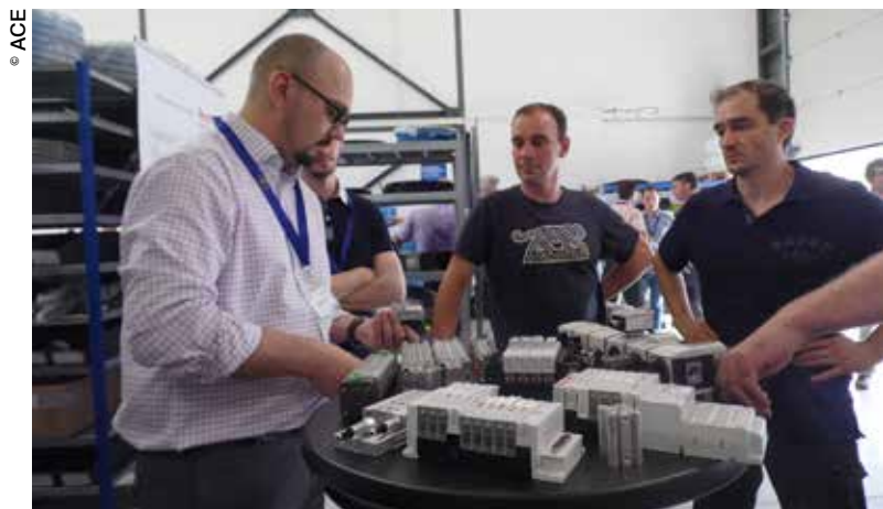
L'entreprise bourguignonne met un point d'honneur à développer des liens étroits avec ses partenaires.

Cette reconnaissance vient consacrer les efforts déployés par ACE pour aller au-delà des composants et se positionner en tant que spécialiste d'équipements complets livrés clés en main. Cette tendance ne fera que s'accroître, prévoient les res-